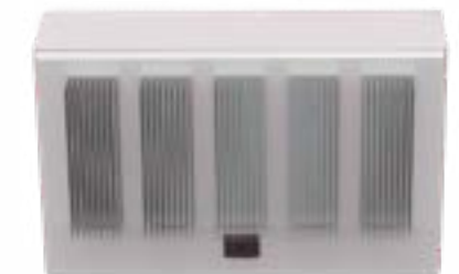
Série Affinity Eclipse (DISPONIBLE AU PRINTEMPS 2025)