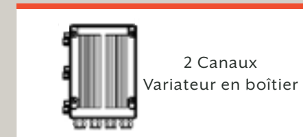
2 Canaux Variateur en boîtier