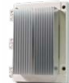
Série Affinity Dimme