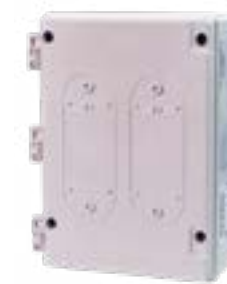
Série Affinity Smart-Heat On/Off