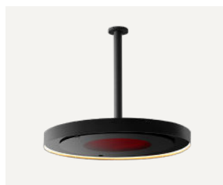
Palo dritto da 600 mm