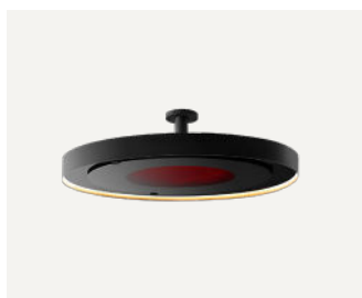
Palo dritto da 200 mm