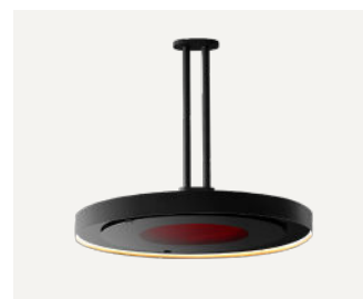
Twin Pole da 600 mm