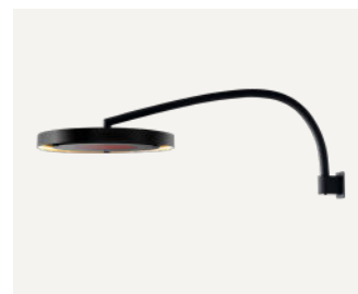
Supporto a parete

Scopri di più su Eclipse Smart-Heat™ Electric