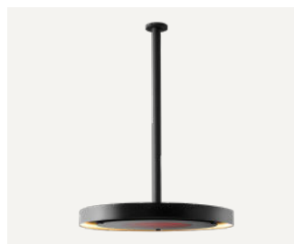
Palo dritto da 1200 mm