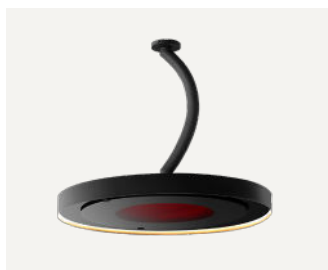
Palo curvo da 600 mm