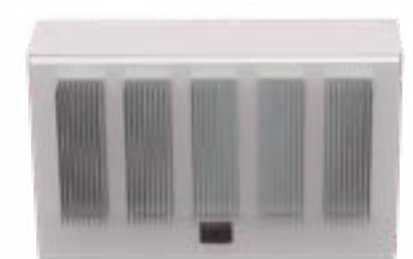
Serie Affinity Smart-Heat Eclipse (DALLA PRIMAVERA 2025)