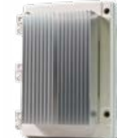
Serie Affinity Smart-Heat Dimmer