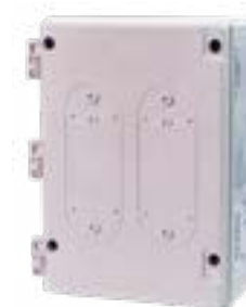
Serie Affinity Smart-Heat On/Off