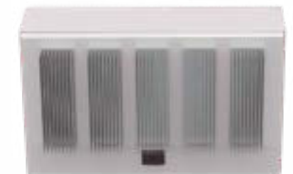
Serie Affinity Smart-Heat Eclipse (PRIMAVERA DE 2025)