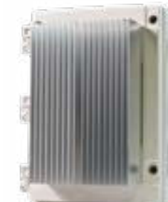
Serie Affinity Smart-Heat Dimmer