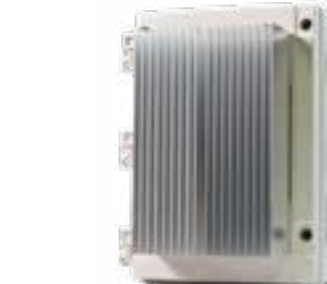
Affinity Dimmer Serie